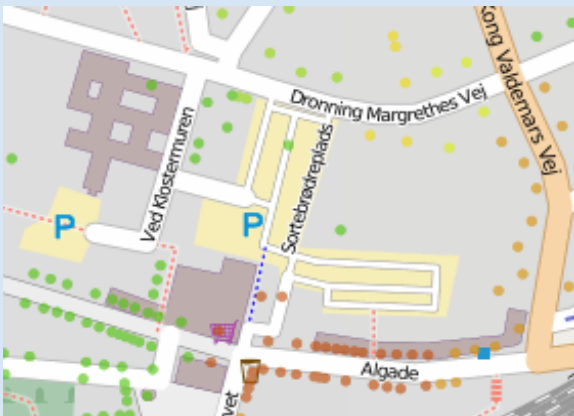
Eksempel på koncentrationsberegninger på adresser i det centrale Roskilde

Sundhedsskadelig luftforurening - hvor du bor Vi kan beregne koncentrationen af sundhedsskadelige stoffer på en hvilken som helst adresse i Danmark. Her illustrerer vi det for alle veje i Roskilde og omegn. Vi beregner koncentrationen af partikler, som anses for at være det største sundhedsproblem i forhold til luftforurening. Vi beregner også koncentrationen af kvælstofdioxid, som også er sundhedsskadelig.